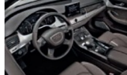
LIFESTYLE E CAR Lussi tecnologici